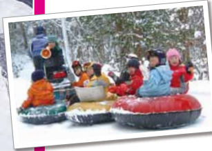
運が良ければ、かわいい動物たちに出会えるかも♪

スノーモービルに引っ張られながらの雪上クルージング。源流の大自然のレクチャーもしてくれます。